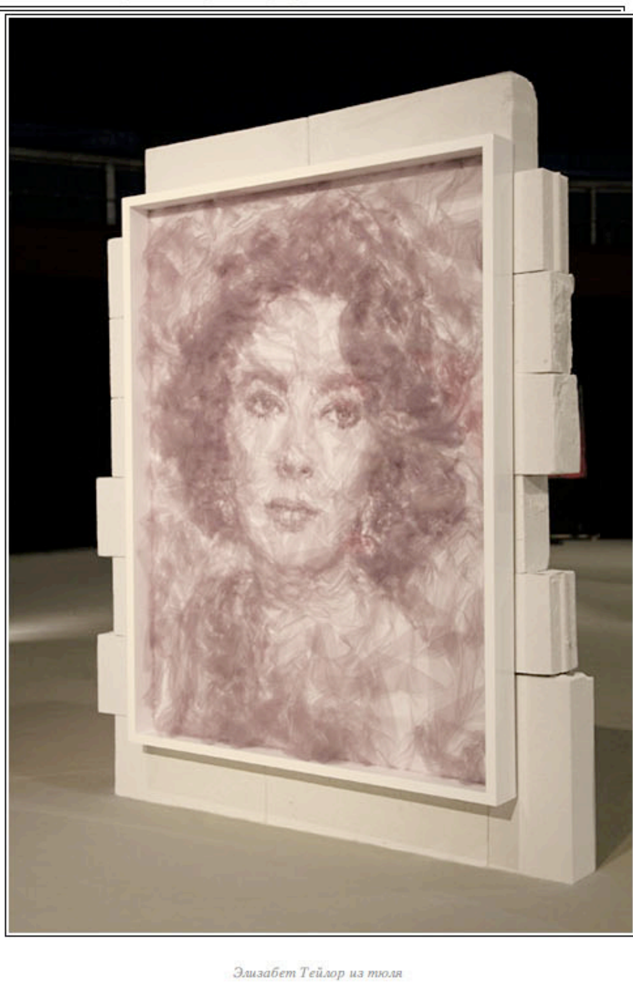
Элизабет Тейлор из тюля

Как это часто бывает, идея рисовать тюлем пришла художнику в голову совершенно случайно. Задумав нарисовать портрет Рембрандта, этого гениального жонглера светом и тенью, пребывая в поисках новых образов и идей, Бенджамин машинально комкал в руках кусочек черного тюля, неведь как попавшего к нему в руки. Тогда он обратил внимание на ее мягкость и податливость, послушность каждому движению. Но окончательно его пленила такая естественная способность прозрачной ткани: в зависимости от количества слоев менять оттенки от ультра-светлого до экстра-темного. Эта находка и стала ключевой, - в следующий миг родился арт-проект Бенджамина Шайна под названием "Tulle".