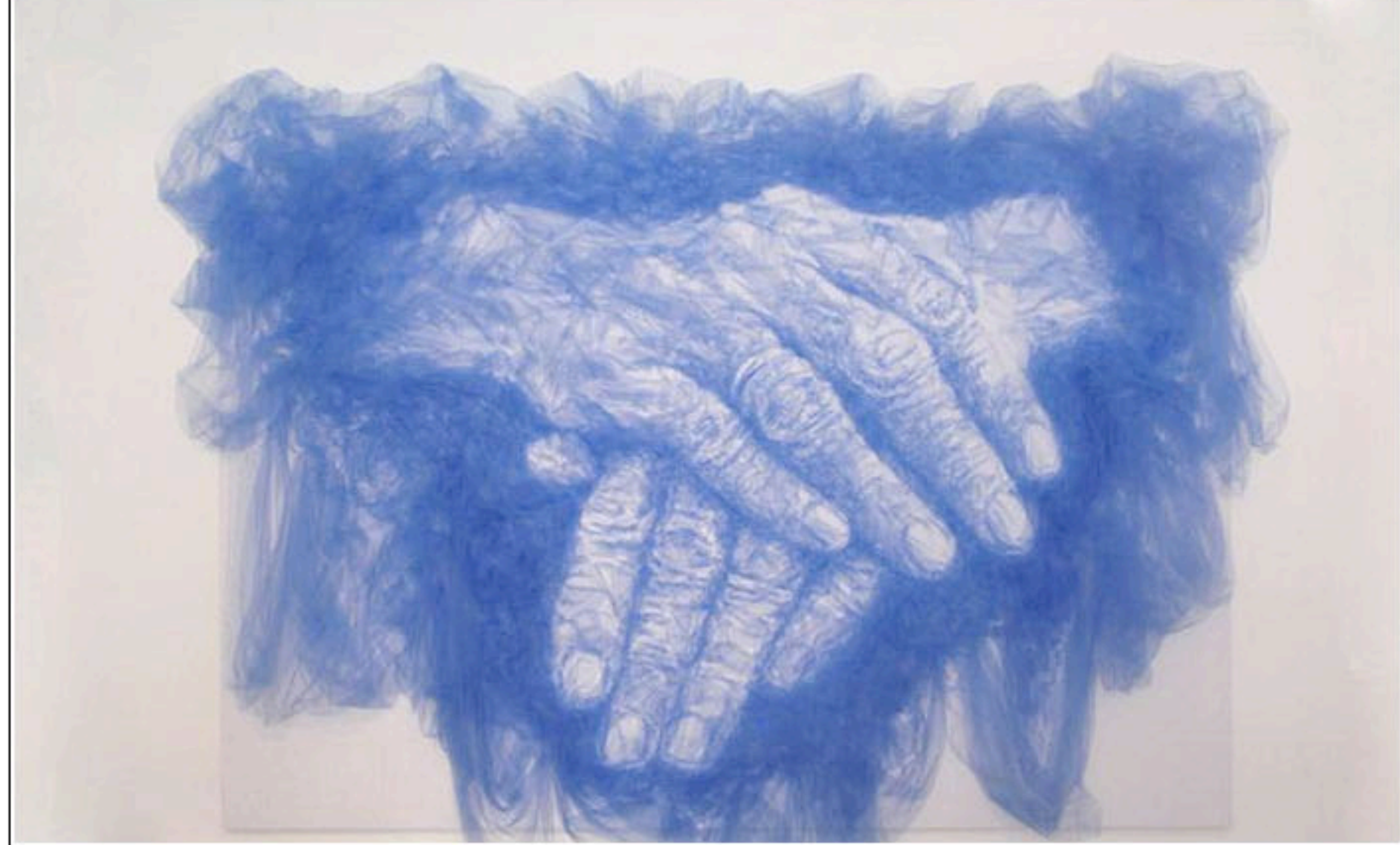
Инсталляция Hands of Time из арт-проекта Tulle

Кроме портретов, художник создает также удивительные инсталляции из тюля. Увидеть все это своими глазами можно на интернет-сайте Бенджамина Шайна (Benjamin Shine).