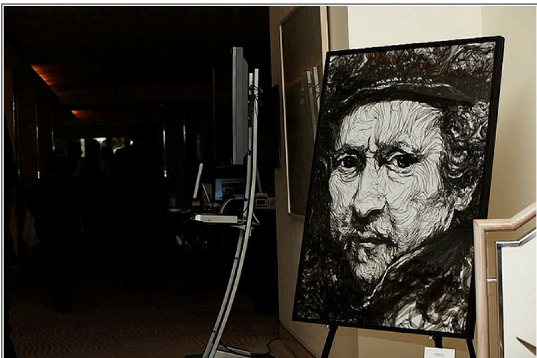
Портрет Рембрандта, нарисованный тюлем

Если бы вы увидели британского художника Бенджамина Шайна (Benjamin Shine) за работой, вы бы никогда не подумали, что именно сейчас, в эту минуту, на ваших глазах рождается новый портрет мировой знаменитости. Со стороны это выглядело бы совершенно иначе. В руках - утюг вместо кисточки, на столе - прозрачная ткань вместо холста, а перед нами - мужчина, занятый домашними делами, старательно наглаживающий занавески. Портреты, нарисованные тюлем, - это новый арт-проект "Tulle" от Бенджамина Шайна.