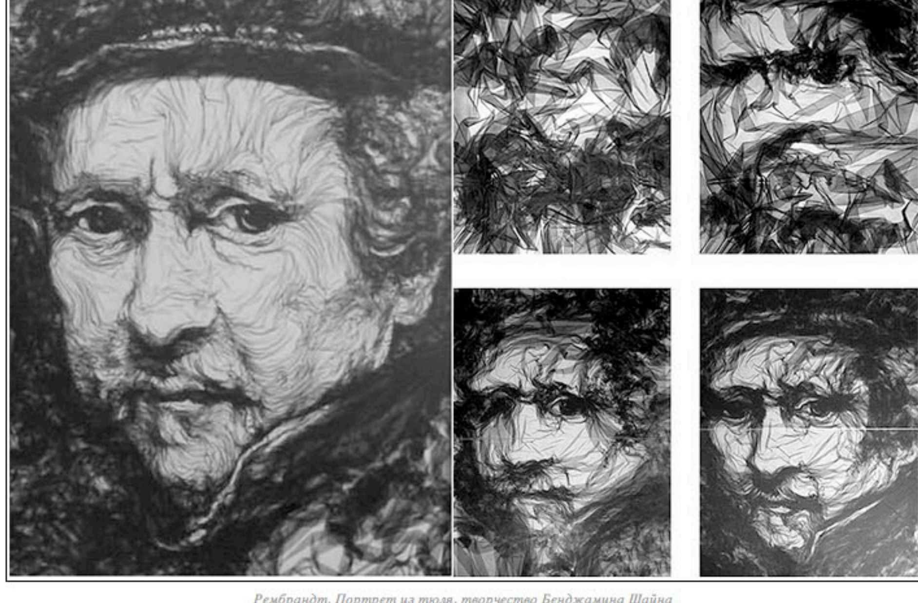
Рембрандт. Портрет из тюля, творчество Бенджамина Шайна