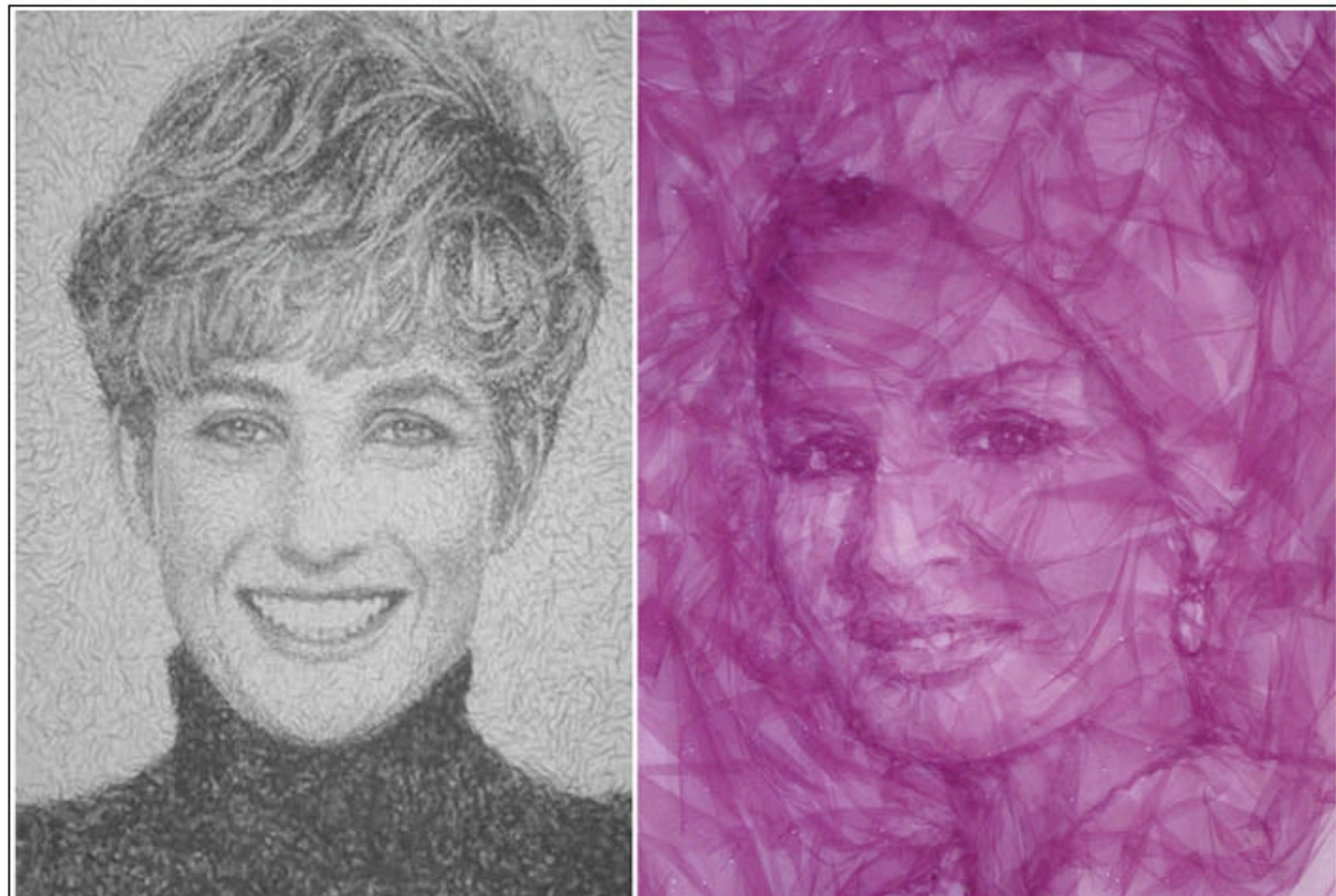
Принцесса Диана и Шейха Моза, первая леди Катара. Портреты из серии Tulle